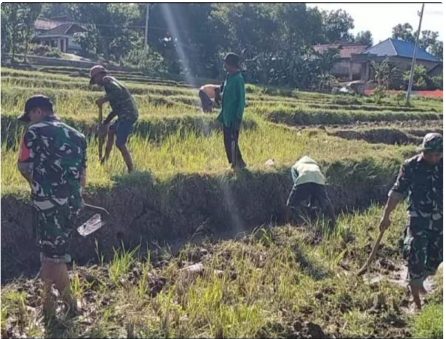
Sukseskan Ketahanan Pangan, Babinsa Koramil 0804/10 Kawedanan Bantu Pengolahan Tanah

MAGETAN. - Demi sukseskan ketahanan pangan, Babinsa Koramil Tipe B 0804/10 Kawedanan jajaran Kodim 0804/Magetan Desa Giripurno Sertu Salahudin turut membantu petani saat penyiapan pengolahan lahan yang akan