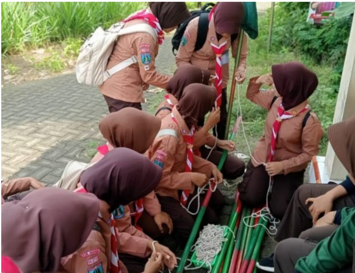
Saka Wira Kartika Koramil 0804/08 Barat Gelar Penjelajahan Dalam Penempuhan SKK

Magetan. - Saka Wira Kartika Koramil Tipe B 0804/08 Barat menggelar kegiatan penjelajahan penempuhan SKK di wilayah Koramil Tipe B 0804/08 Barat dan sekitarnya. Kegiatan ini bertujuan untuk memperkuat jiwa kepemimpinan, kedisiplinan, serta semangat cinta tanah air di kalangan peserta. Selasa (10/12/2024)