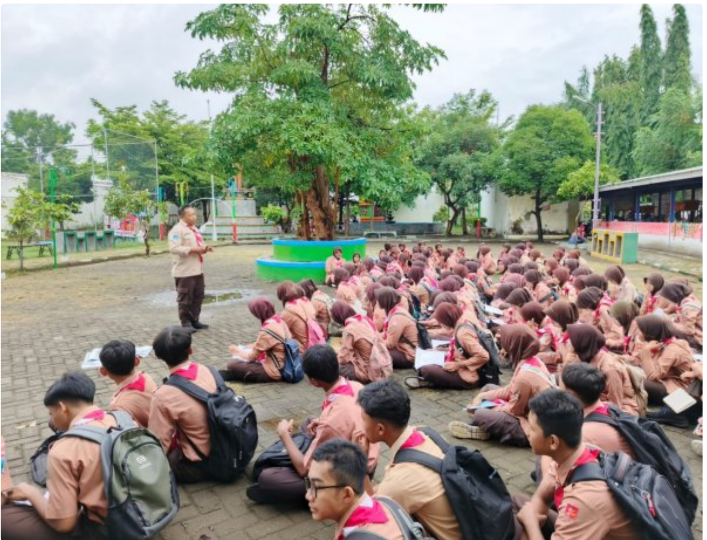
Pembinaan Pramuka Saka Wira Kartika Materi Krida Navigasi Darat Untuk Pengembangan Keterampilan

Magetan. - Dalam rangka memperkuat kemampuan dan keterampilan anggota Pramuka Saka Wira Kartika melaksanakan pembinaan dan pelatihan Krida Navigasi Darat (Navrad). Acara ini diikuti oleh 125 orang anggota pramuka dari