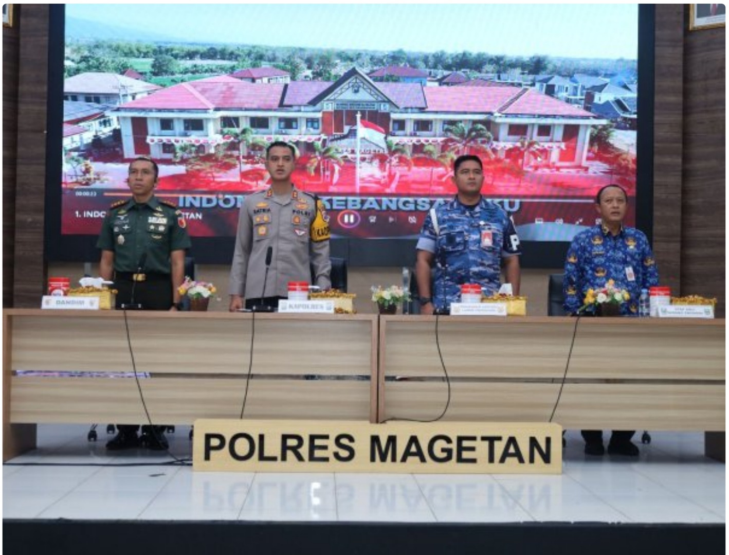
Dandim 0804/Magetan Hadiri Rakor Lintas Sektoral kesiapan operasi lilin 2024

Magetan. – Guna meningkatkan Sinergitas dalam rangka kesiapan operasi lilin 2024 pengamanan Hari Raya Natal 2024 dan Tahun Baru 2025 di wilayah Kabupaten Magetan yang aman dan kondusif.